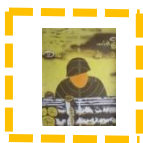
- Cel do granatu